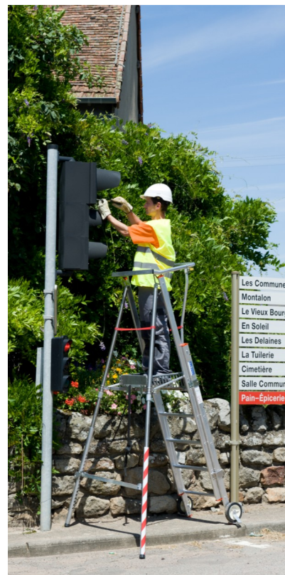
Version Polyvalente 302021